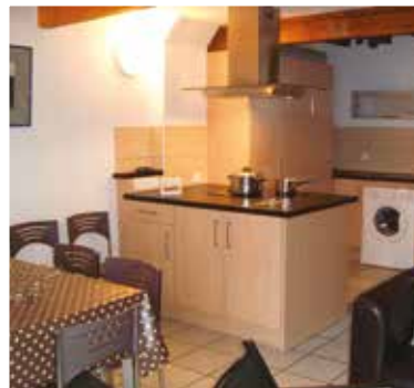
Appart. 6/8 pers

Acompte réservation 25% du tarif séjour. Supplément Animaux 13 €/semaine. Taxe de séjour : adultes 0,42 €. Remise des clés au Camping Airotel Pyrénées situé à l'entrée de Luz-Saint-Sauveur. Règlement : chèques vacances acceptés.