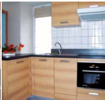
Appart 4 pers Balcon