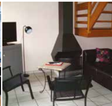
Appart 6/8 pers