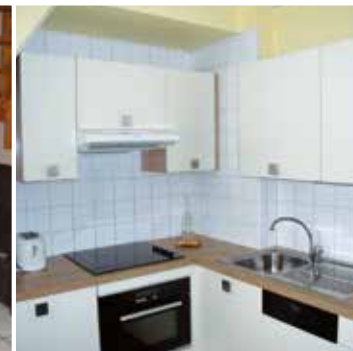
Appart 4 pers Rez-de-jardin